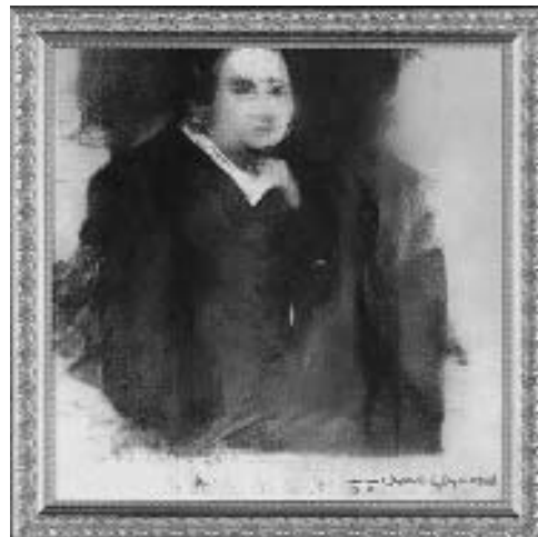
Рис. 7. Портрет Едмонда Беламі, створений нейромережею GAN, 2018 рік