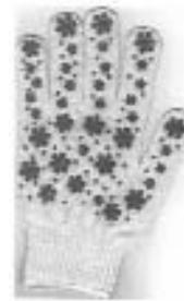
Рис. 1. Зображення промислового зразка за патентом України № 24307

Для наочності викладеного вище наведемо приклад із зображенням промислового зразка (Рис. 1).