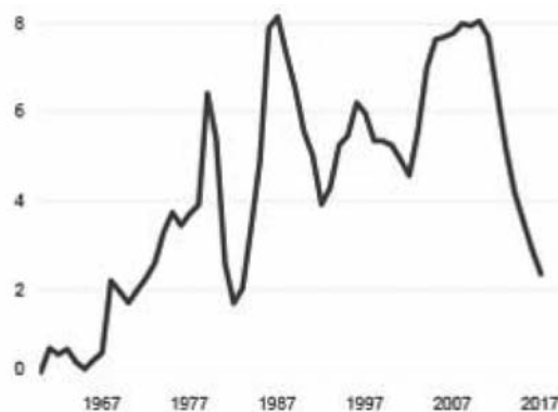
Рис. 2. Співвідношення наукових публікацій і патентних сімейств ШІ [6]