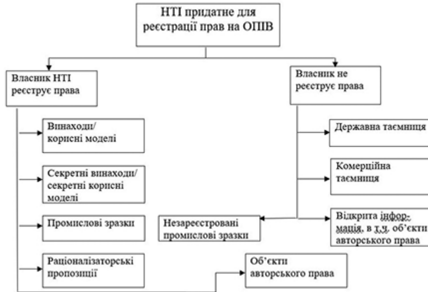
Рис. 2. Охорона НТІ за варіантом В1

напрямами: чи є така НТІ інформацією з обмеженим доступом (як правило, для цього використовують трискладовий тест за вимогами [2, ч. 2 ст. 6]);