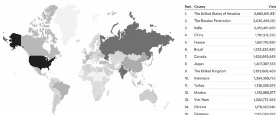
Рис. 2. Рейтинг найбільш активних піратських країн

Найбільшим медіасектором, на який припадало 46,6 % усього трафіку, що йде на піратські web-сайти, є телевізійний контент. Протягом перших восьми місяців 2022 року було визначено деякі помітні тенденції в даних MUSO щодо піратства в розрізі різних галузей. Із січня по серпень 2022 року експерти MUSO зафіксували